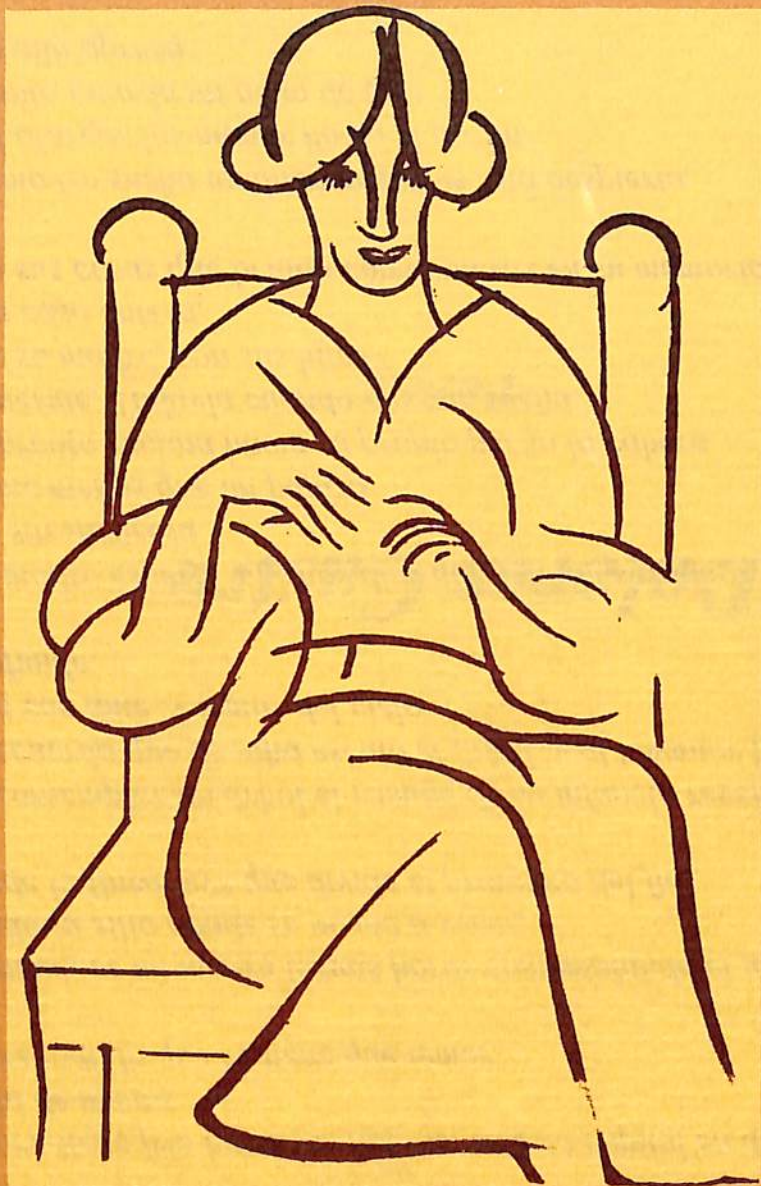
Estudio de mujer sentada, s/f. Tinta/papel, 19 x 12.5 cms.