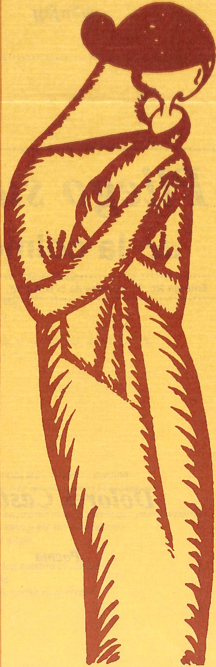
Beso maternal, s/f. Tinta/papel, 13 x 19 cms.